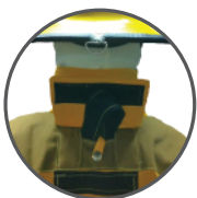
DRD NFPA 2013