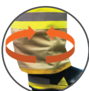
Elástico en pantalones y tobillos