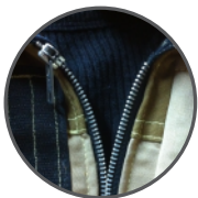
Zipper de escape