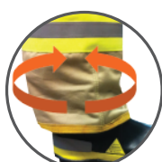
Elástico en pantalones y tobillos