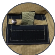
DRD NFPA 2013